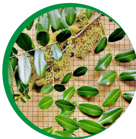
Folhas e flores