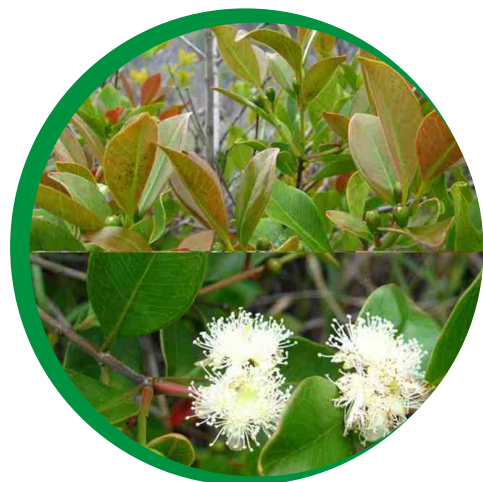
Folhas e flores