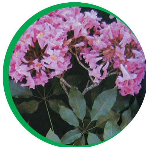
Folhas e flor