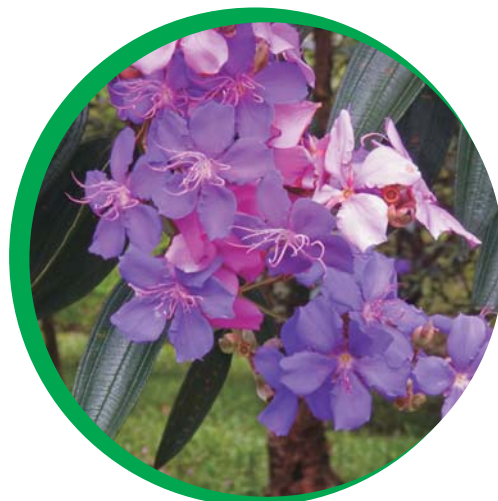
Folhas e flor