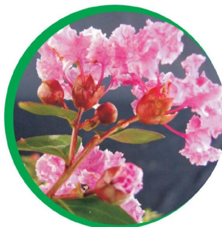
Folhas e flor