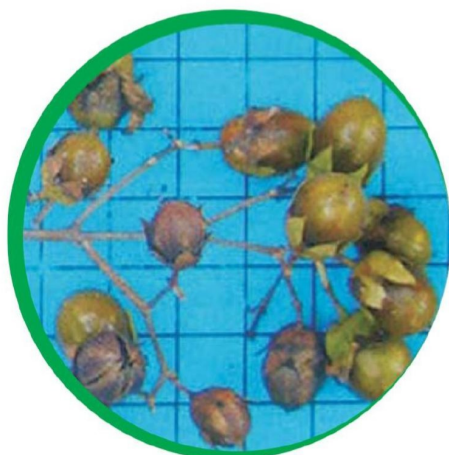
Fruto e sementes