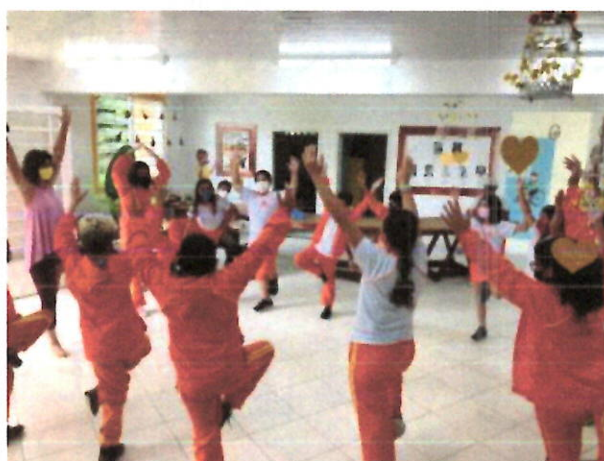
Alunos da EM Presidente Getúlio Vargas